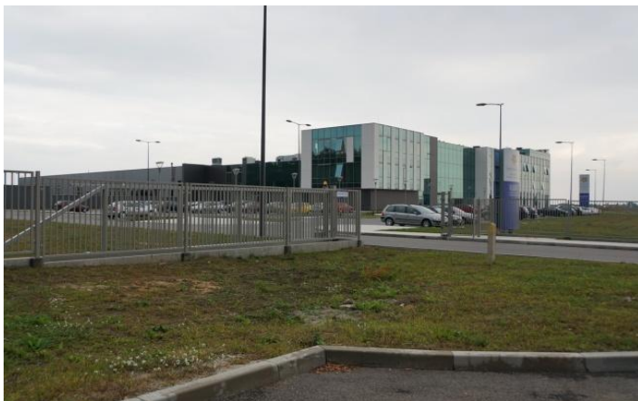
Okoliczna zabudowa przemysłowa