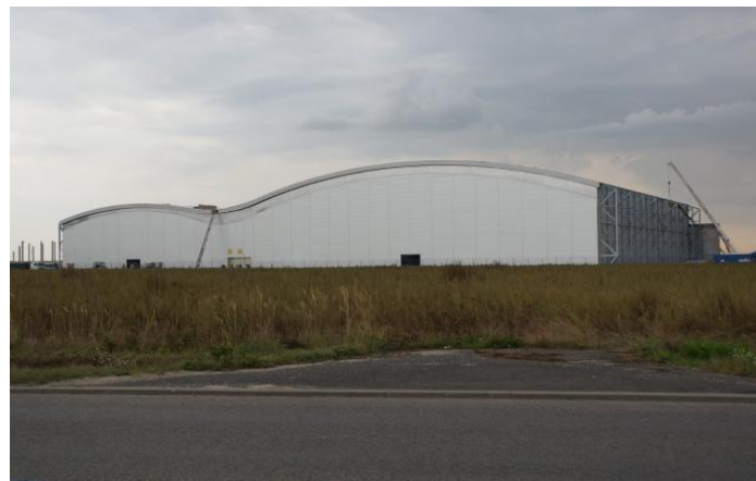
Okoliczna zabudowa przemysłowa