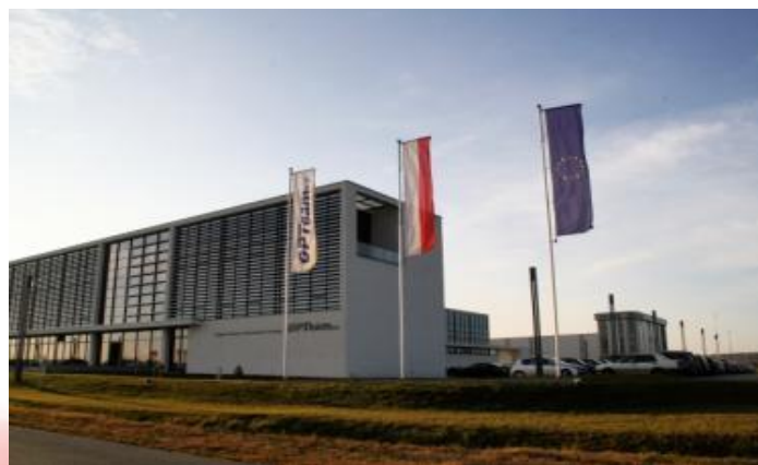
Usługi i produkty zaawansowanej technologii