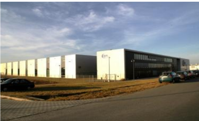
Nowoczesne obiekty w sąsiedztwie