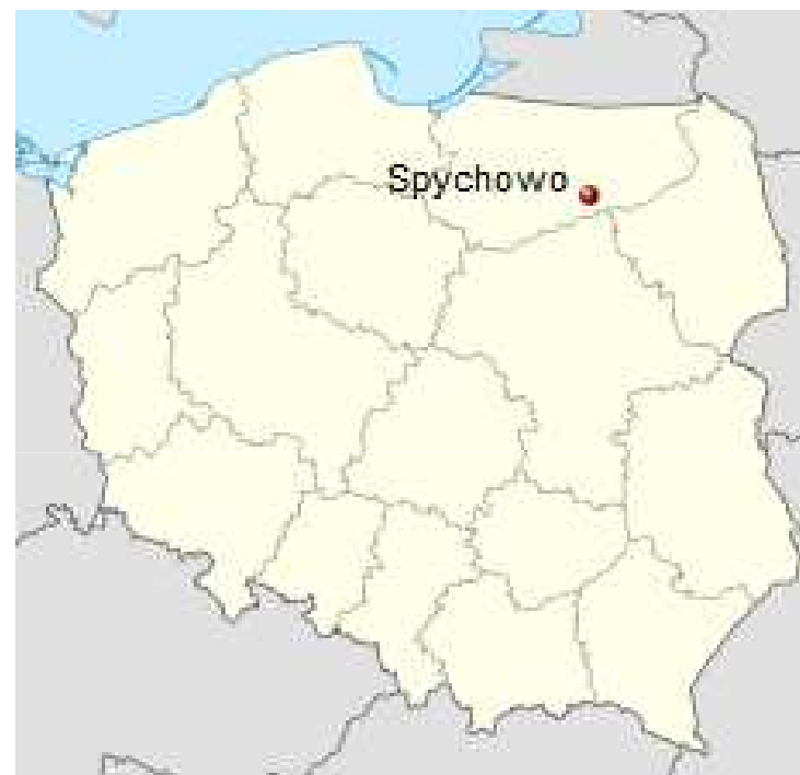
Położenie miejscowości na mapie Polski.