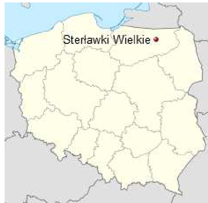
Położenie miejscowości na mapie Polski.