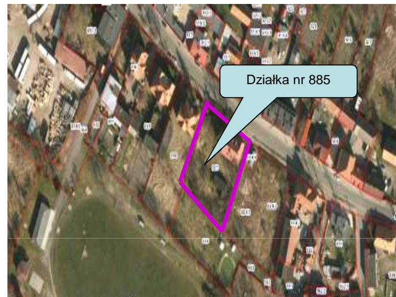
Położenie Nieruchomości