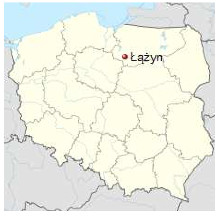
Położenie miejscowości na mapie Polski.