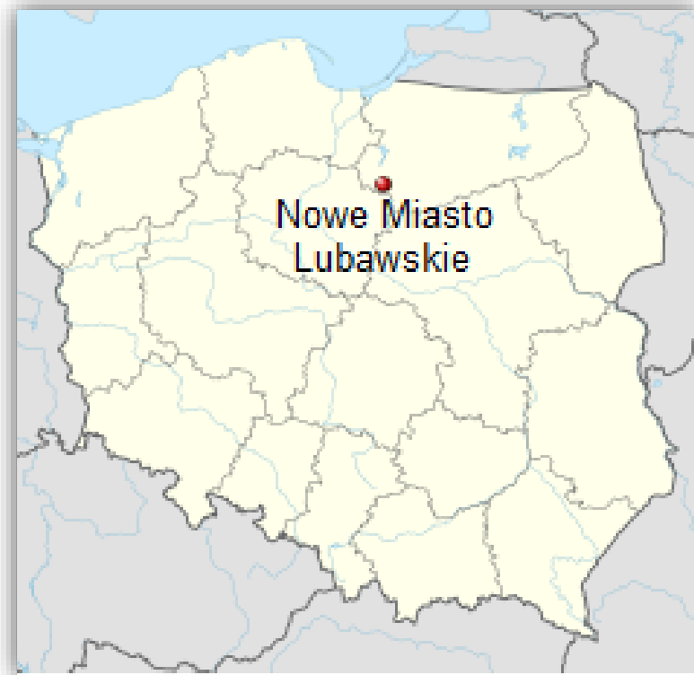
Położenie miejscowości na mapie Polski.