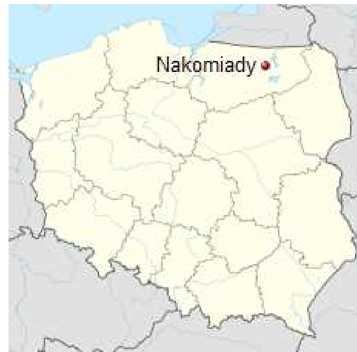
Położenie miejscowości na mapie Polski.