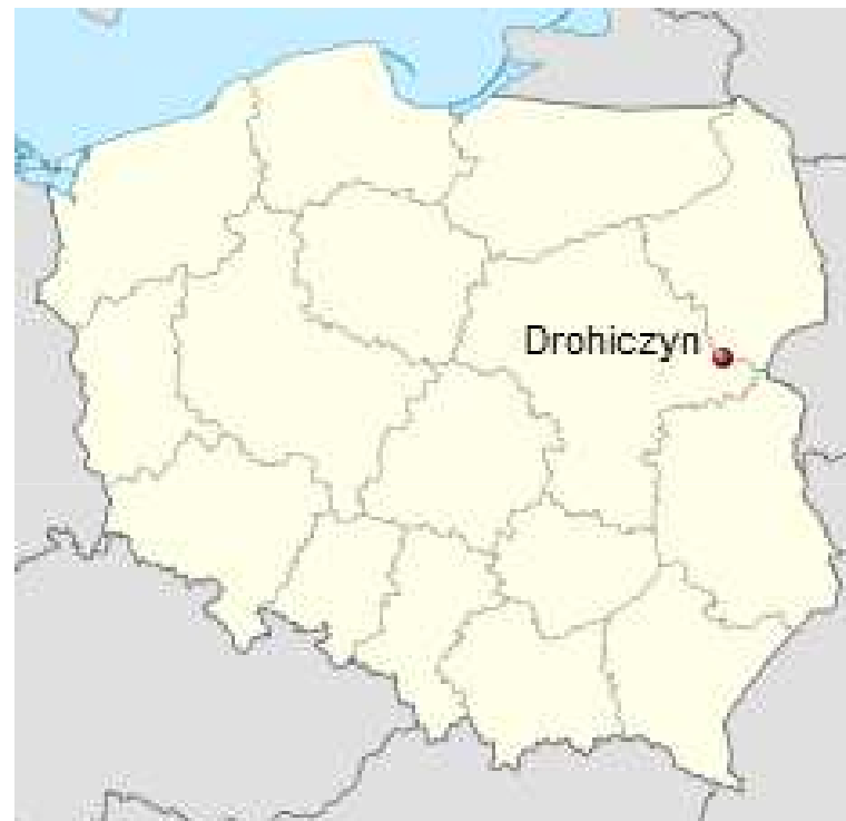
Położenie miejscowości na mapie Polski.