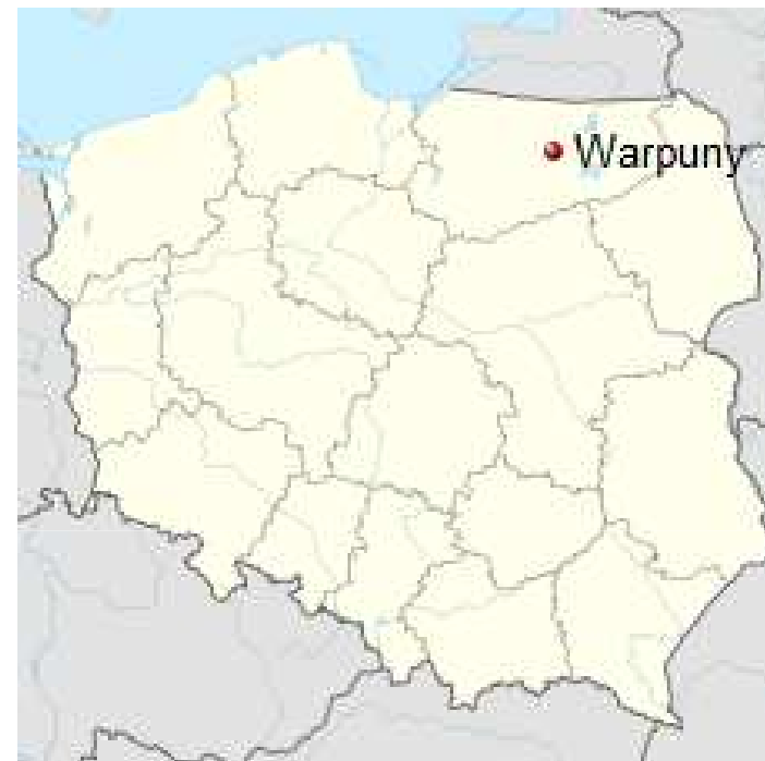
Położenie miejscowości na mapie Polski.