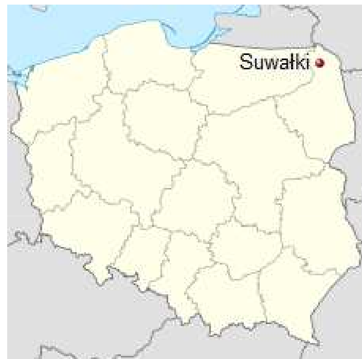
Położenie miejscowości na mapie Polski.