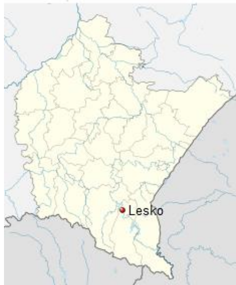
Położenie na mapie województwa podkarpackiego