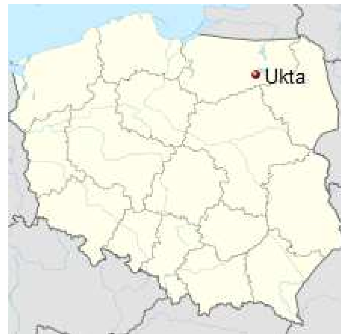
Położenie miejscowości na mapie Polski.