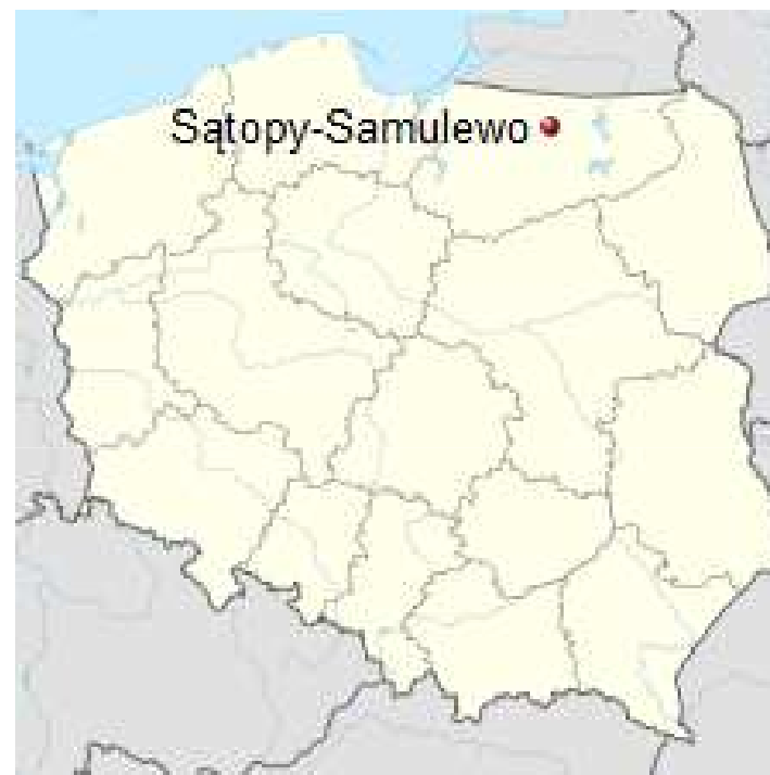
Położenie miejscowości na mapie Polski.