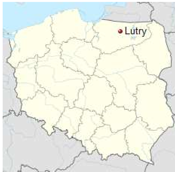
Położenie miejscowości na mapie Polski.