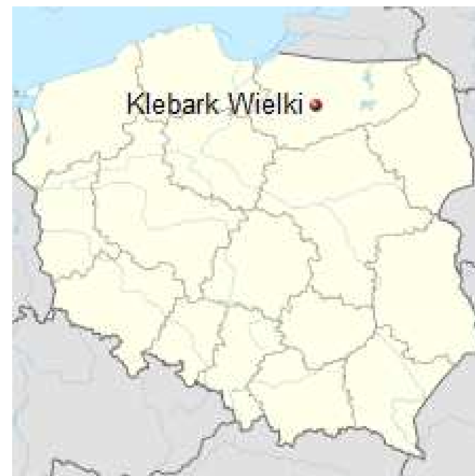
Położenie miejscowości na mapie Polski.